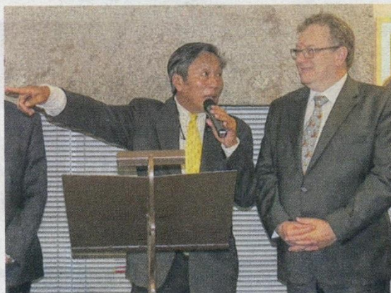
L'ambassadeur du Laos est très impressionné par Dinan et le fonds Pavie.

À l'issue de ces deux décennies de coopération entre Champassak et Dinan, une exposition est donc présentée